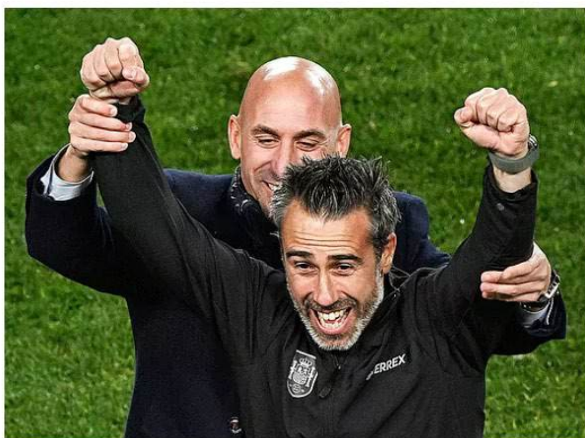
Jorge Vilda y Luis Rubiales, después de la victoria de España ante Suecia.

Después de la renuncia de 'Las 15', el técnico se reunió con ellas, acercó a las familias y ha sido «valiente». La relación con la plantilla (y entre ellas) sigue tensa, pero las victorias les han unido.