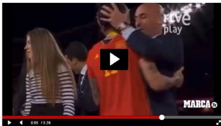
Rubiales repitió el beso de Casillas a Carbonero... ¡con Jenni Hermoso!

El presidente de la RFEF agarró la cara de la jugadora con las dos manos y le plantó un pico después de haberse fundido en un largo abrazo