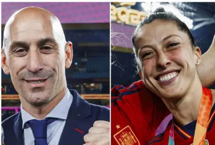
El beso de Rubiales a Hermoso es algo que le ha traído muchos problemas.

El alemán sabe lo que es ser campeón del mundo y perder la compostura en los festejos