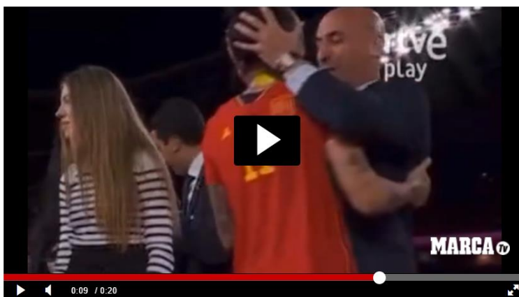
Rubiales repitió el beso de Casillas a Carbonero... ¡con Jenni Hermoso!

El presidente de la RFEF agarró la cara de la jugadora con las dos manos y le plantó un pico después de haberse fundido en un largo abrazo