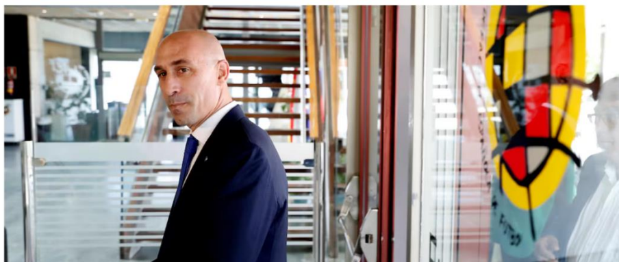
Captura de noticia del 16 de septiembre de 2023 publicada en El País

El expresidente de la Federación, hijo de alcalde, futbolista del montón, trabajador obsesivo, impulsivo y prepotente, viajó de la cima al abismo en tres segundos. Una excolaboradora asegura: “Es un machista que no sabe que lo es, como tantos otros”