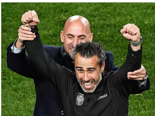
Jorge Vilda y Luis Rubiales, después de la victoria de España ante Suecia.

Después de la renuncia de 'Las 15', el técnico se reunió con ellas, acercó a las familias y ha sido «valiente». La relación con la plantilla (y entre ellas) sigue tensa, pero las victorias les han unido.